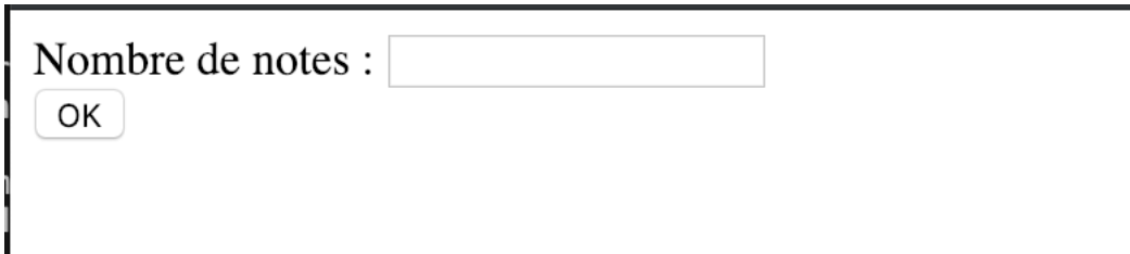
Figure 1 - Exemple de formulaire pour la saisie du nombre de notes

On désire créer un formulaire html qui permet à l'utilisateur de saisir un nombre de notes qu'il choisira. Nommer ce fichier : tpstat.html.